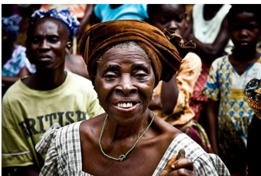
Une bénéficiaire du projet

60% déserte en eau potable APRÈS le projet