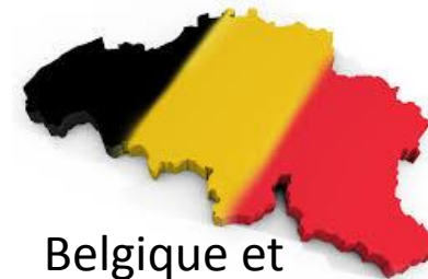
Belgique et Wallonie