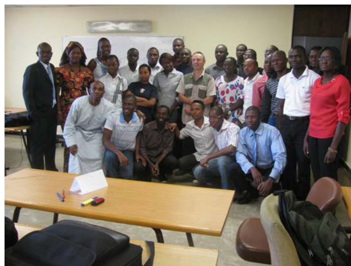
Seconde promo du Master GAP en 2012

Au total 17 pays ont participé à ce programme depuis qu'il a démarré en 2008, avec 10 pays de l'Afrique de l'Ouest et 6 de l'Afrique centrale et Madagascar, pour un total de 49 étudiants. Le Sénégal est le pays qui a très largement bénéficié du Master (plus de 20% du total des personnes formées). Le Burkina Faso, le Togo, la Côte d'Ivoire et le Niger sont aussi bien représentés.