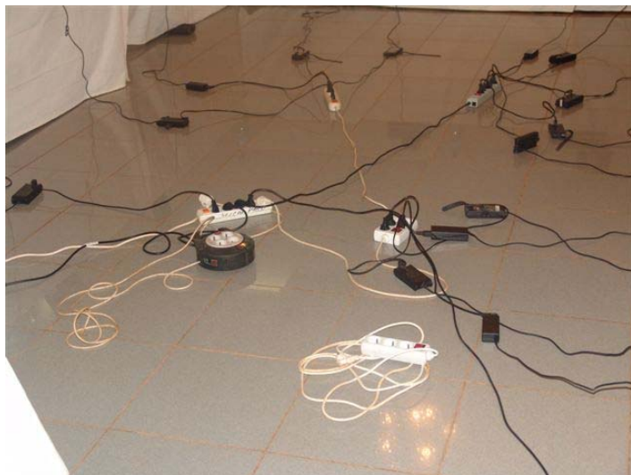
Les Mooc sont un moyen d'élargir l'audience des formations en connectant l'offre et la demande

d'acteurs. Les MOOCs sont un développement récent dans l'éducation à distance, et ont commencé à émerger en 2012. Les MOOCs ont le potentiel d'améliorer l'éducation en ligne dans les pays en développement en facilitant la collaboration entre les personnes, les lieux et les technologies. Prenant tout cela en considération, un MOOC sur la gestion des aires protégées en Afrique francophone pourrait s'avérer pertinent.