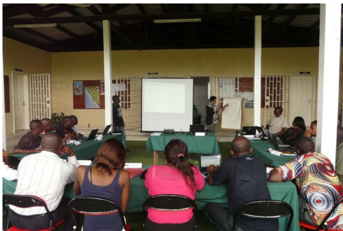
La 7ème promotion du DU au Gabon en 2012 : le Mooc peut être un bon complément aux formations en présentiel

En Afrique, plusieurs initiatives de renforcement des capacités ont donc été créées, par exemple, le Diplôme Universitaire sur la gestion des aires protégées de l'UICN-Papaco (fait avec l'Université Senghor) pour les jeunes professionnels (voir article précédent). Le cours est destiné aux gestionnaires des aires protégées et aux scientifiques, ONG ou partenaires du secteur privé. Malheureusement, ces initiatives restent limitées et reçoivent un nombre très élevé et croissant d'applications. En plus de la forte demande, les coûts importants de l'éducation en Afrique, sont un obstacle à l'extension de ces formations.