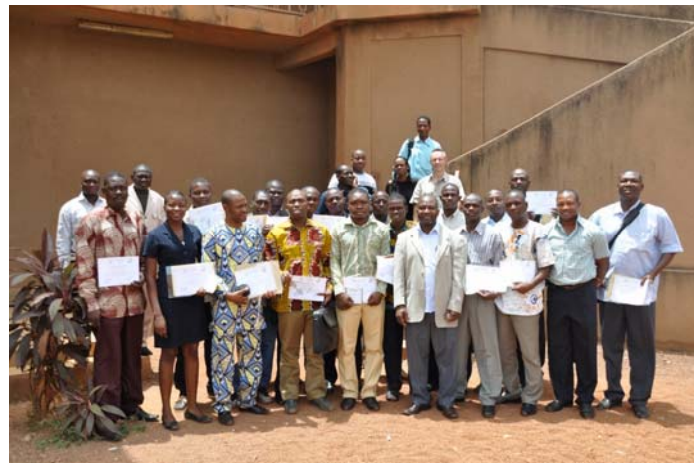
Première promo du DU GAP à Ouagadougou en 2011

par l'Université Senghor. Les enseignants sont des experts sélectionnés sur base de leur expérience dans la région. La formation est dispensée intégralement en français. Au moment de cette étude, la formation avait été dispensée cinq fois pour l'Afrique de l'Ouest 1 depuis Janvier 2011, pour un total de 99 participants (nb : la dixième édition débutera ce mois-ci à Ouagadougou ).