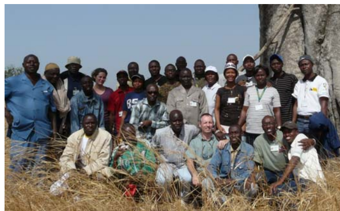
Première promo du Master GAP, en 2009

Après cinq éditions du DU en Afrique de l'Ouest et deux éditions du Master (Afrique de l'Ouest et du Centre), une évaluation a été conduite afin de comprendre les effets de la formation sur la carrière des personnes formées et sur la conservation. En particulier, les perceptions des anciens étudiants et comment la formation a affecté leur travail quotidien ont été évalués et des recommandations pour améliorer la formation ont été formulées.