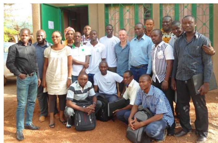
8ème promotion du DU à Ouagadougou en 2014 – le Mooc peut aussi permettre aux étudiants de continuer leur formation une fois rentrés chez eux

Le format commun est généralement un cours de sept semaines. La norme est d'environ 2 heures de conférence constituées de 5 à 10 vidéos de 10 à 12 minutes chacune par semaine. Les étudiants voient d'abord l'enseignant d'introduire le sujet, mais peu de temps après, le focus se déplace sur ce que le professeur écrit. Au lieu de tableaux, les ordinateurs ou tablettes sont utilisés, sur lesquels le professeur écrit, tout en parlant. La deuxième composante majeure des MOOCs est formée des devoirs. Les étudiants doivent télécharger ces devoirs chaque semaine, ce qui dans certains MOOCs très populaires peut être difficile. Ces devoirs sont évalués automatiquement lorsque possible. Comme alternative, l'évaluation peut être confiée aux étudiants eux-mêmes, en leur demandant de juger leurs pairs. La troisième composante des MOOCs est un forum, ce qui ajoute une dimension sociale à l'enseignement. La quatrième composante est un certificat délivré par l'université (ou l'institut de formation) aux étudiants qui réussissent tous les tests.