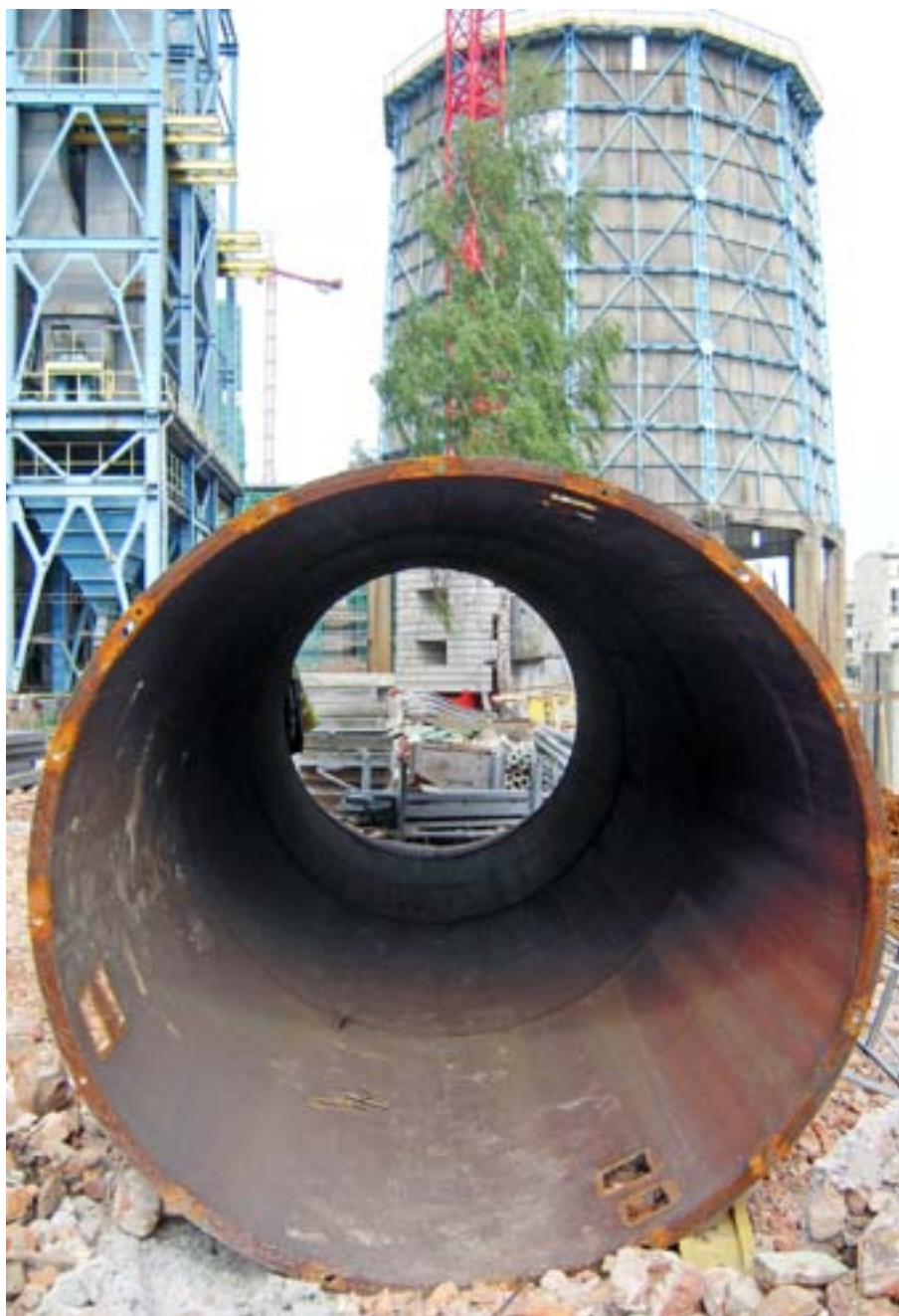
Photo 1 — Travaux de rénovation et de transformation d'une tour emblématique du centre-ville sur le site d'une centrale électrique abandonnée en voie d'être reconvertie en centre artistique et culturel