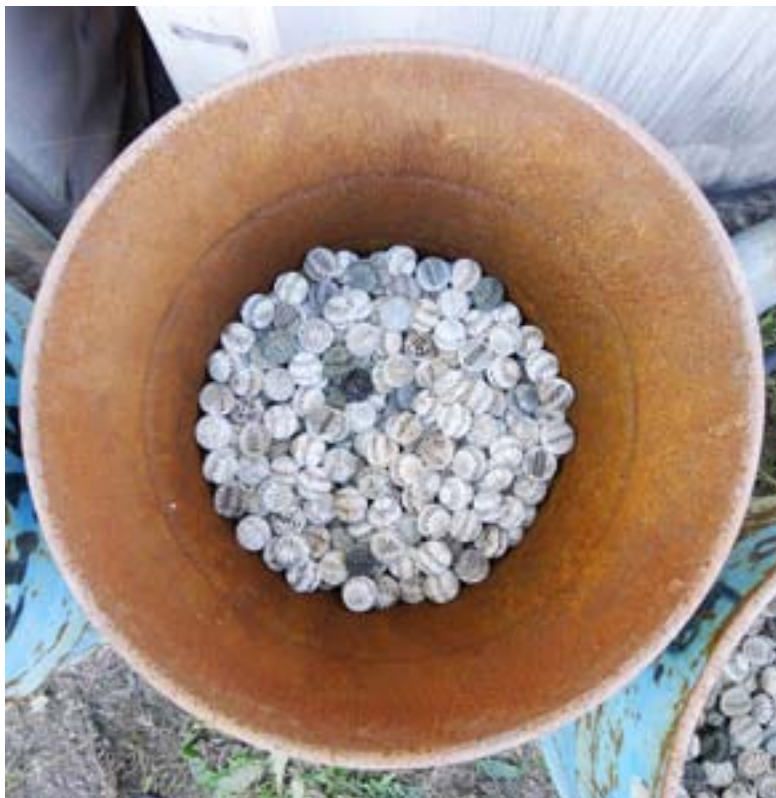
Photo 9 — Baril de billes en plastique utilisées pour l'extraction d'agents polluants présents dans le sol d'un site contaminé (Dunaújváros, Hongrie)