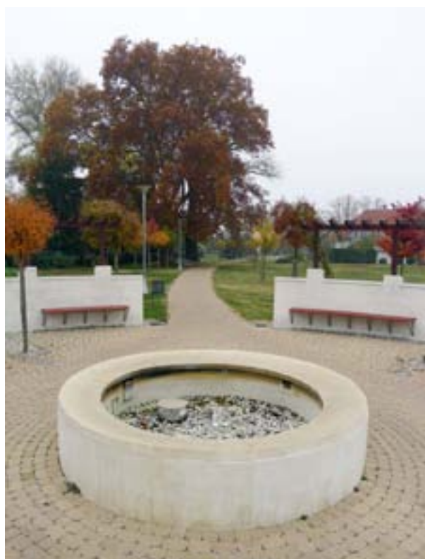
Photo 5 — Parc municipal sur le site d'une ancienne usine de batteries après réalisation de travaux de décontamination et construction d'installations de loisirs (Marcali, Hongrie)