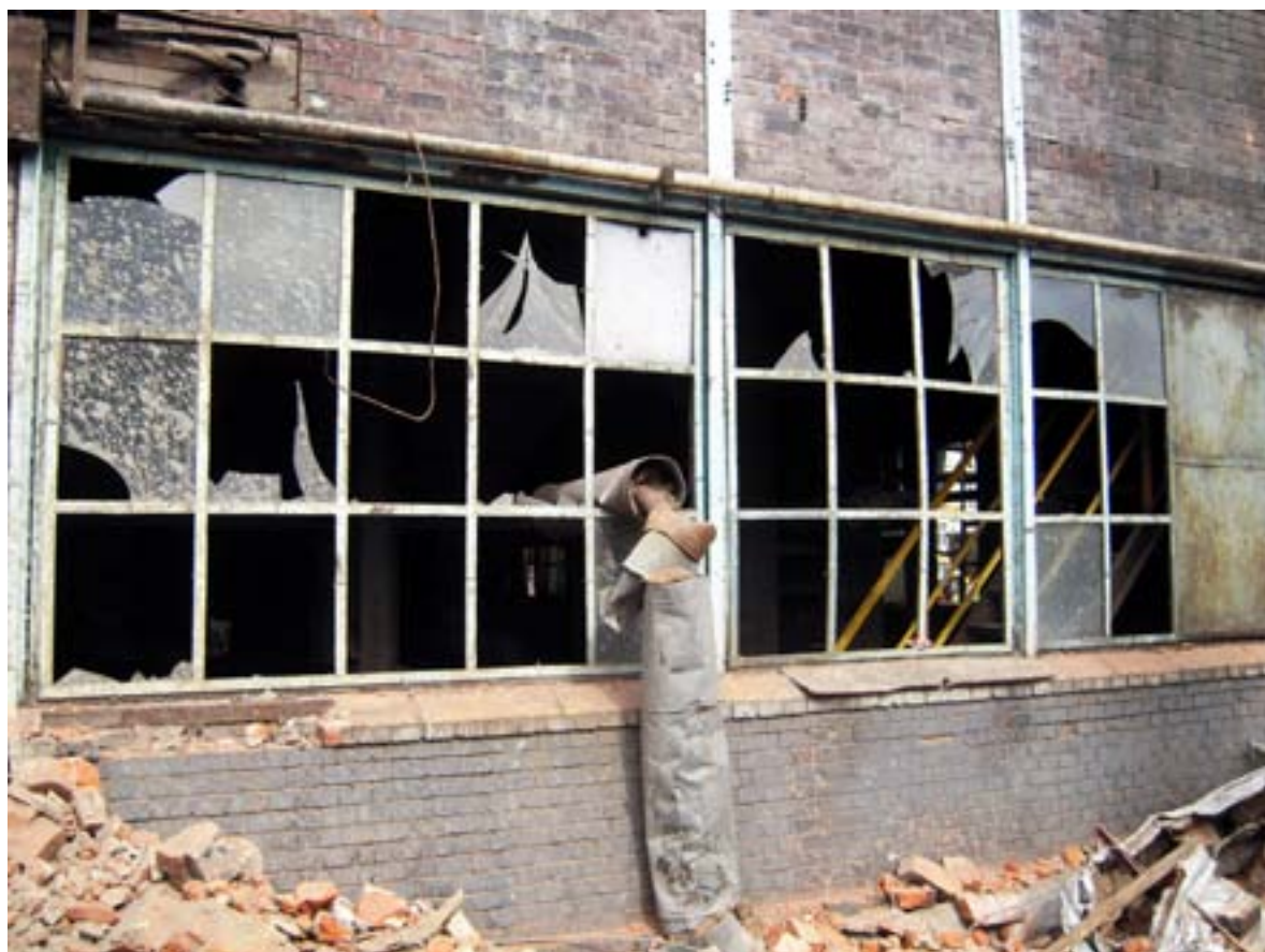
Photo 8 — Démolition et rénovation de bâtiments dans une centrale électrique abandonnée, transformée en centre artistique et culturel (Łódź, Pologne)