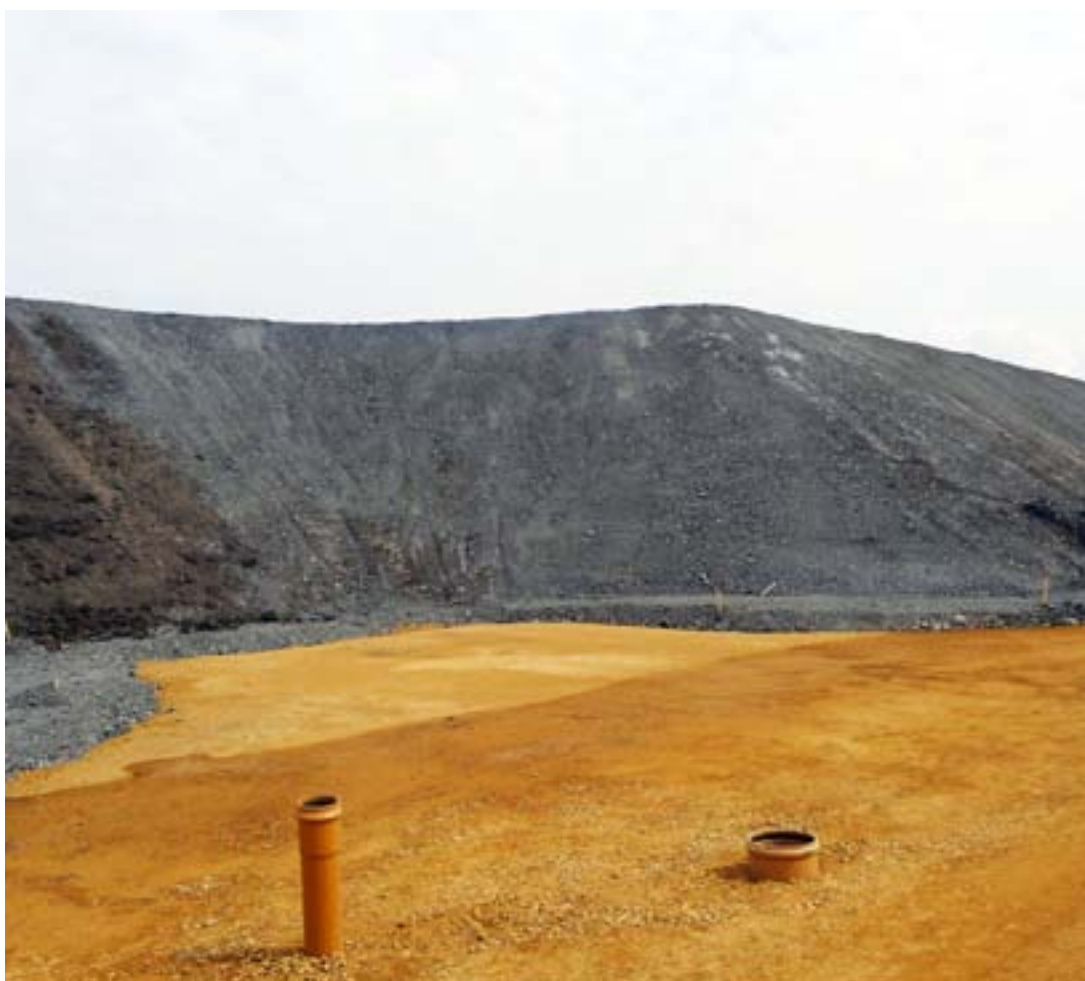
Photo 10 — Terrain préparé en vue de la construction d'une infrastructure routière sur le site d'un ancien terril (Jaworzno, Pologne)