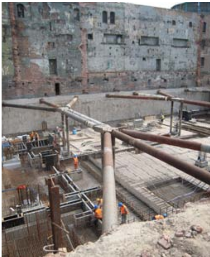
Photo 3 — Préparation de nouvelles structures dans une ancienne centrale électrique (Łódź, Pologne)