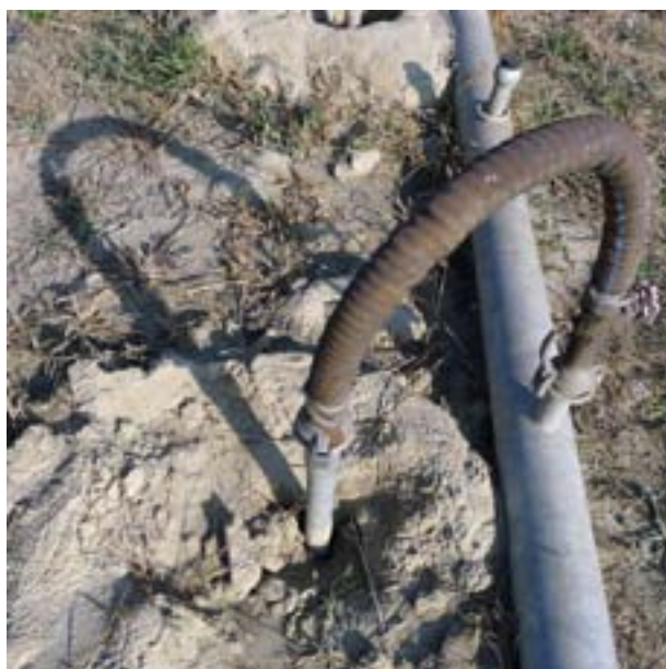
Photo 2 — Tuyau injectant des produits nettoyants dans le sol pollué d'une aciérie (Dunaújváros, Hongrie)