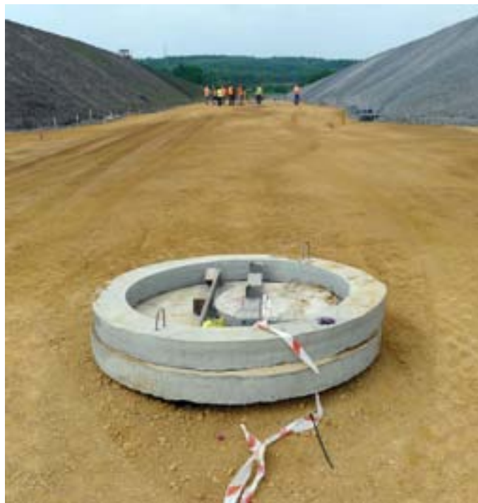
Photo 4 — Construction de routes et d'installations collectives sur le site d'un ancien terril (Jaworzno, Pologne)