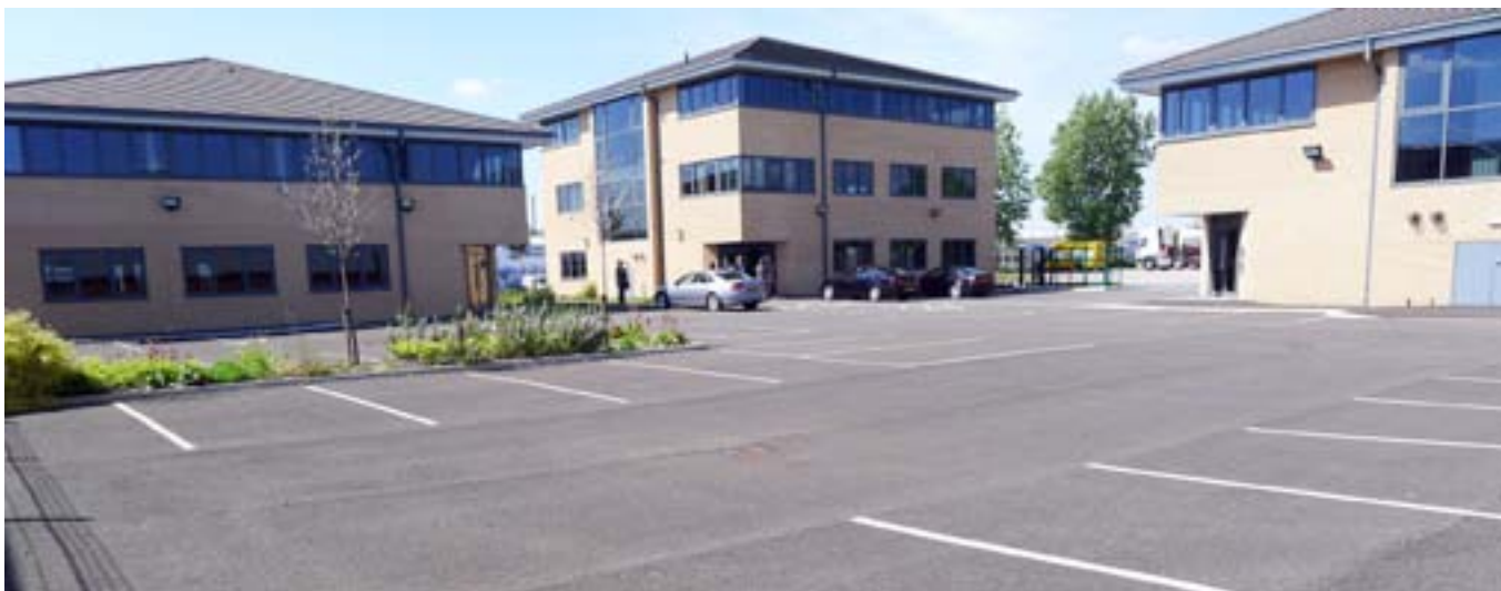
Photo 6 — Bureaux clés en main construits sur le site d'une ancienne usine de produits chimiques (Widnes, Royaume-Uni)