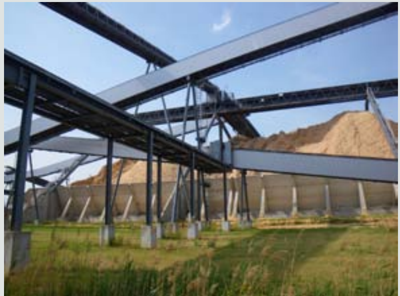
Photo 7 — Usine de cellulose sur le site d'un ancien projet de centrale nucléaire (Arneburg, Allemagne)

En ce qui concerne l'ancienne mine à ciel ouvert de Rotherham (Royaume-Uni), le site a été régénéré par un partenariat public-privé. La contribution du partenaire privé, qui consistait en des terrains, a été évaluée à 30 % du coût total du projet, et les travaux de régénération, à la charge du partenaire public, ont été estimés à 70 %. Toutefois, à la vente des terrains, 70 % du produit de la vente ont été alloués au partenaire privé et 30 % au partenaire public. Cette situation avantageait le propriétaire privé, ce qui n'était pas conforme au régime relatif aux aides d'État applicable.