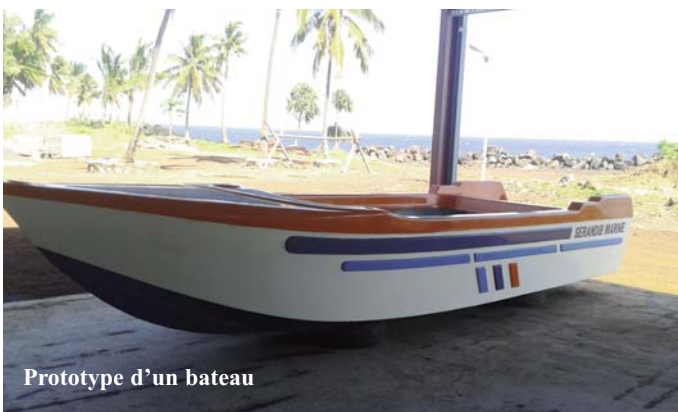
Prototype d'un bateau

- Réalisation d'une première phase de négociations