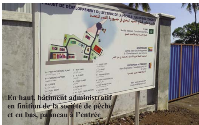
En haut, bâtiment administratif en finition de la société de pêche et en bas, panneau à l'entrée