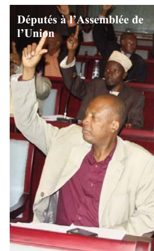
Députés à l'Assemblée de l'Union