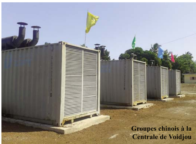
Groupes chinois à la Centrale de Voidjou