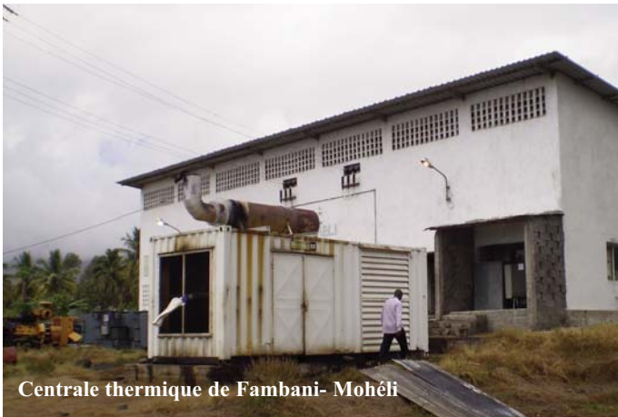
Centrale thermique de Fambani- Mohéli

solaires destinés aux populations nécessiteuses en milieu rural.