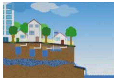
Goutte d'or – Prix Eau de Paris « Right under our nose » Roger Emanuel Lourenso Brésil (2008) 90 sec

Istanbul, Spots de moins de 90 secondes pour les jeunes entre 17 et 30 ans.