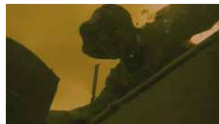
Goutte d'or Prix Agence française de développement « Living and dying in the swamp » Luc Riolon France (2007) 52 min

Istanbul, Œuvres audiovisuelles à caractère scientifique et pédagogique