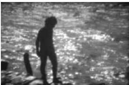
Mention spéciale « Una mancha en el agua » Pablo Romano Argentine (2006) 20 min