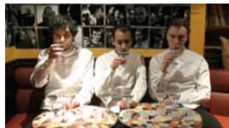
Prix du jury « Les goûteurs » Eau de Paris