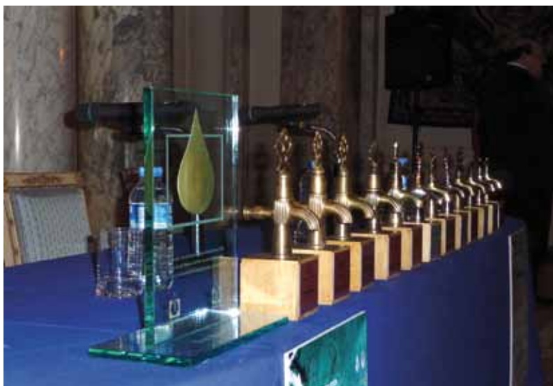
Les trophées des RIEC, Istanbul 2009.

Une des dernières manifestations, les Rencontres parisiennes « Eau et Cinéma » du 18-25 mars 2010 au Pavillon de l'eau en partenariat avec Eau de Paris , ont permis la diffusion de 43 films, avec des avant-premières, conférences-débats avec le public, concours VidéEau en partenariat avec Dailymotion : 75 films sur le thème de « L'eau et Paris ». Une 2 e édition se prépare pour le 18-23 mars 2011.