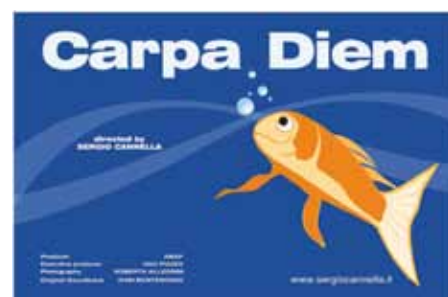
Goutte de bronze Prix Office international de l'eau « Carpa Diem » Sergio Cannella Italie (2006) 2 min