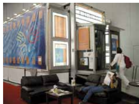
Le cinéma « La roulotte », salle où se déroulaient les projections à Mexico, 2006.