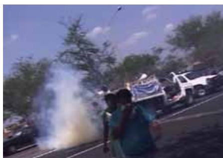
Goutte de bronze – Prix RIOB « 13 pueblos en Defensa del Agua, el Aire y la Tierra » Francesco Taboada Mexique (2007) 60 min