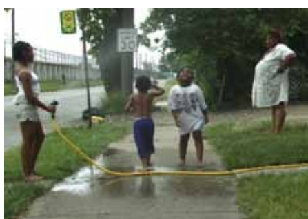
Goutte d'argent Prix Agence Eau Seine-Normandie « The Water Front » Elizabeth Miller Canada (2007) 52 min