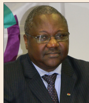
Filipe SAVADOGO Représentant Permanent de l'OIF à l'ONU Permanent Representative of OIF to the UN