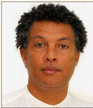
Mario Lucio de Sousa Ministre de la Culture du Cabo-Verde Minister of Culture of Cabo-Verde