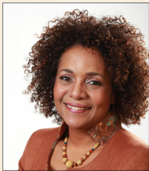
Michaëlle JEAN Envoyée spéciale de l'UNESCO pour Haïti UNESCO Special Envoy for Haiti