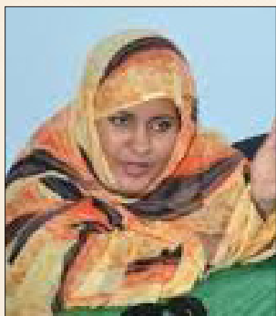
Vatma Vall Mint SOUEINIE Ministre de la culture de Mauritanie Minister of culture, Mauritania