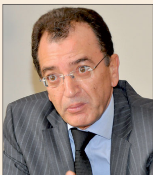
Mohammed Amine SBIHI Ministre de la culture du Maroc Minister of culture, Morocco