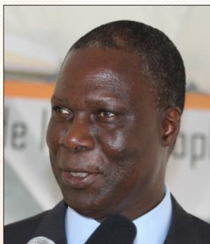
Maurice KOUAKOU BANDAMA Ministre de la Culture et de la Francophonie de la Côte d'Ivoire Minister of Culture and the Francophonie of Côte d'Ivoire