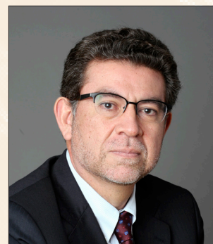
Gustavo Meza-Cuadra VELASQUEZ Représentant permanent du Pérou à l'ONU Permanent Representative of Peru to the UN