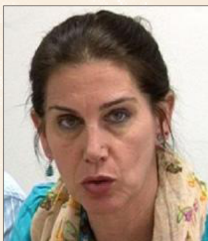
Mirela KUMBARO Ministre de la culture d'Albanie Minister of culture, Albania